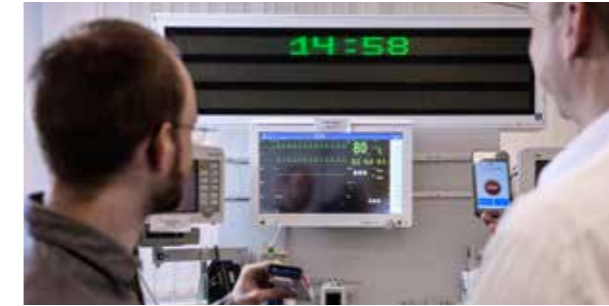
Szenarien praxisnah ausprobieren im Demo-Raum