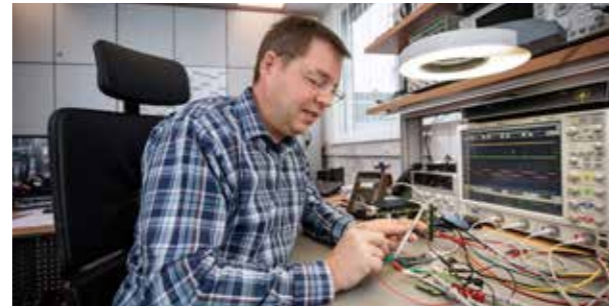
Feinarbeit bei der DAKS-Prototypen-Entwicklung