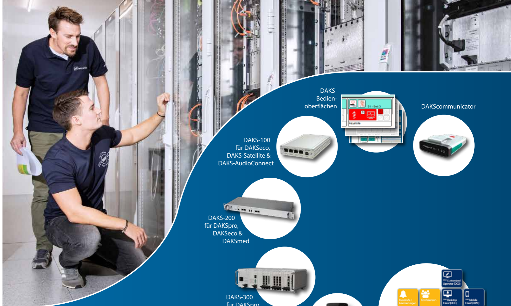
DAKS- Bedien- oberflächen

Unser DAKS-Portfolio entwickeln wir konsequent weiter – für die vielfältigen Alarmierungs- und Kommunikationsanforderungen in allen Branchen.