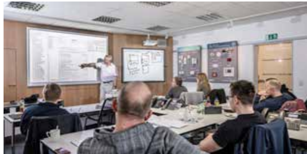
Kompetenz vermitteln im tetronik-Trainingscenter

In Workshops, Produktvorführungen, Live-Tests und Schulungen zeigen wir unseren Vermarktungspartnern und Kunden, wie unsere Produkte optimal eingesetzt werden können. Anschließend erarbeiten wir gemeinsam mit ihnen die Lösungen für die gestellten Aufgaben. Die neuen Abläufe und Funktionen werden dann reibungslos mit der Installation eingeführt und validiert. Erst dann ist ein Problem wirklich umfassend gelöst.