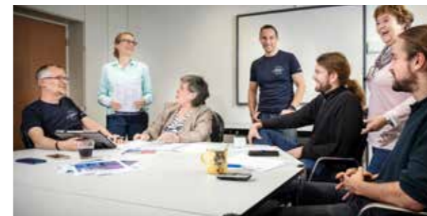
Enge Zusammenarbeit für beste Ergebnisse

Weil wir wissen, wie sehr sich unsere Kunden auf ihre Prozesse verlassen müssen – es geht hier um eine Vielzahl alltäglicher Informationsflüsse, Krisenbewältigungen und Notfallabläufe, mitunter hohe Investitionen und den Schutz von Menschenleben – ist eine kompromisslos herausragende Qualität der wichtigste Anspruch bei unserer Arbeit.