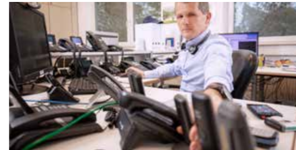
Funktionstests in unterschiedlichsten Systemumgebungen