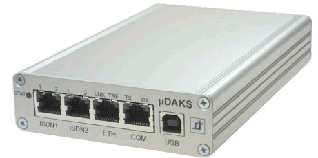
Hardware des DAKS-Eco 100 V2.10 Entry